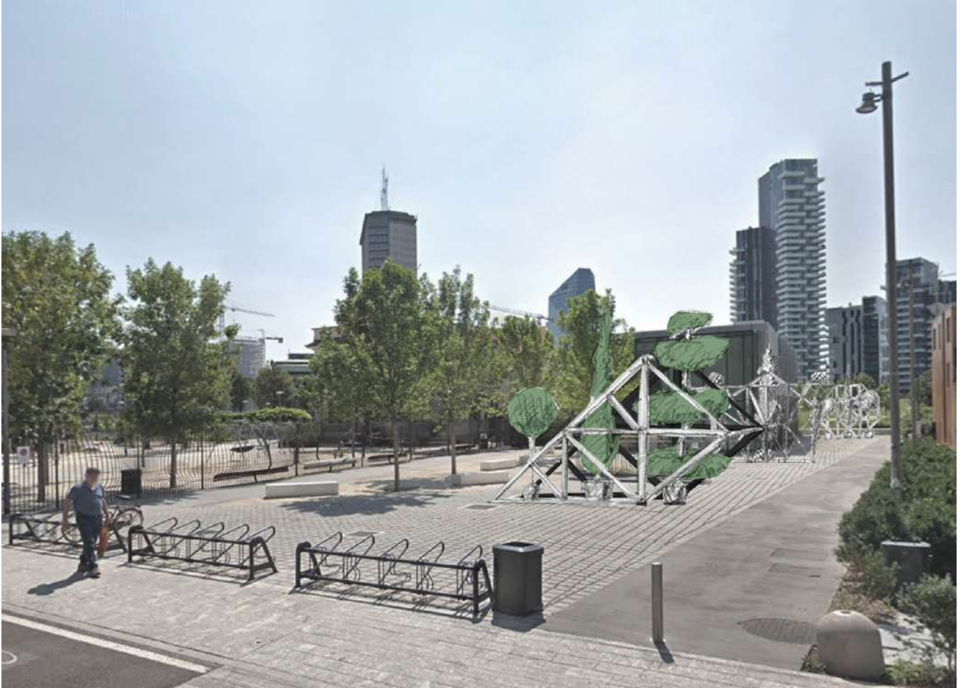
Allestimento 'I Giardini di Leonardo' , di Andrea Liberni con Atelier del Paesaggio.